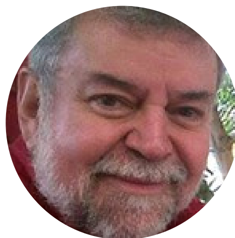
Andrés Ruiz Textos periodísticos