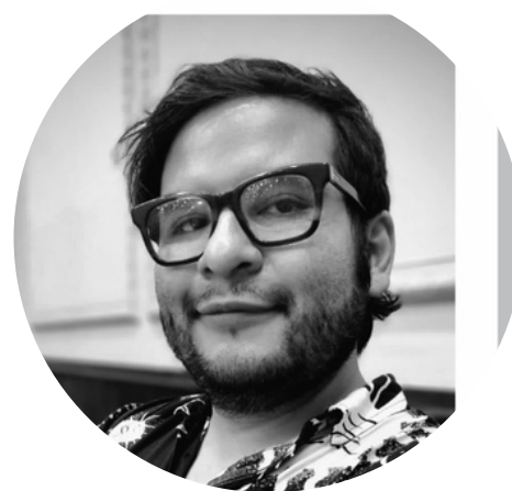
Alberto R. León páginas web