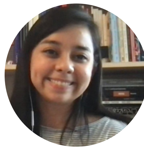
Andrea Martínez Textos publicitarios